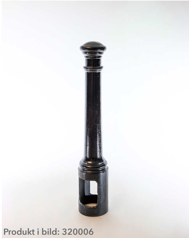
Produkt i bild: 320006

310001, 320006, 320011, 320014, 320025, 320001, 325007