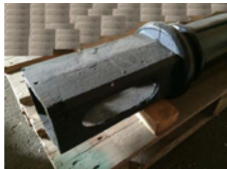
Bild: Rotdel av Pollare för fast montage.

I många fall vill man att pollaren ska ge vika vid påkörning. Det innebär mindre skador på både pollare och bil och därmed lättare att återställa. Minska i så fall då på betongen alternativt avstå helt från betong.